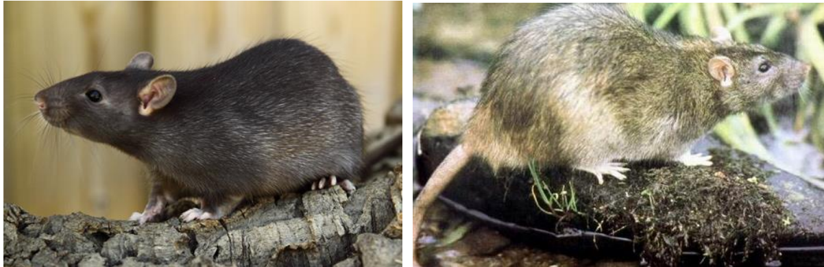
5.29 De zwarte (l) en de bruine rat (r)

Ook de bruine rat wordt bestreden omdat hij, net als de zwarte rat, opgeslagen voedsel bederft en ziekten overbrengt. De bruine rat is weer de verspreider van de Ziekte van Weil. De bruine rat is minder brutaal dan de zwarte en verlaat in het voorjaar meestal de gebouwen om zich langs oevers, bij vuilstortplaatsen enz. te vestigen. De bruine rat komt in heel Nederland algemeen voor.