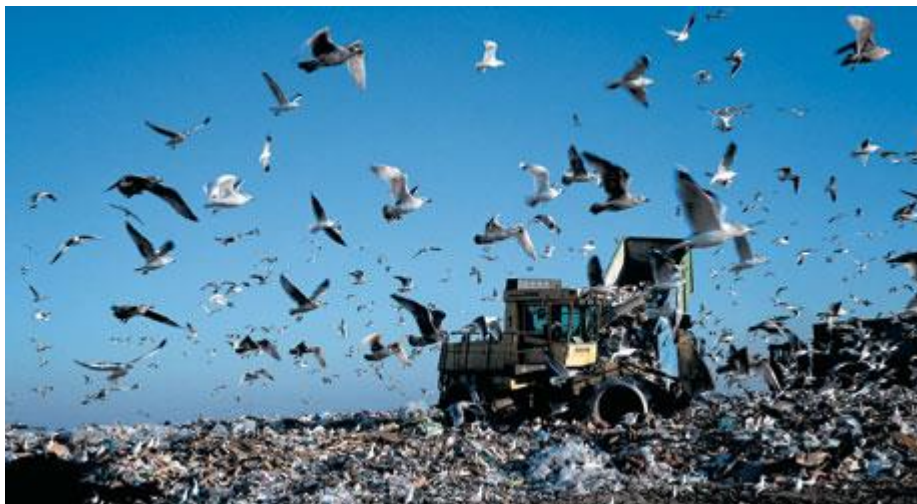
Figuur 5.6. Een stortplaats herken je vaak al van verre.

Grote steden produceren enorme hoeveelheden afval, die tegenwoordig dikwijls worden gerecycled of verbrand. Soms wordt het afval echter ook op hopen gestort, die ten slotte weer met een laag grond worden afgedekt. Tijdens de vorming van de hoop vormt de stortplaats een goede foerageergelegenheid voor diverse alleseters, zoals spreeuwen en meeuwen. Minder opvallend is het leger van bruine ratten, dat een stortplaats al snel in bezit neemt en bij duisternis de hoop afschuimt. De warmte die ontstaat door rotting van het afval zorgt voor omstandigheden waaronder huiskrekels buitenshuis kunnen bestaan en hun gesjirp verradt soms hun aanwezigheid.