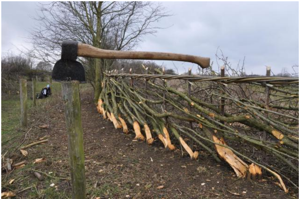
5.9 Een gevlochten heg is ondoordringbaar voor wild.

zouden ze deze biotoop nooit hebben kunnen bereiken. Heggen vormen voor sommige diersoorten dus niet alleen zelf een biotoop, maar ook vitale wegen die vele verschillende, verspreid liggende leefmilieus met elkaar verbinden.