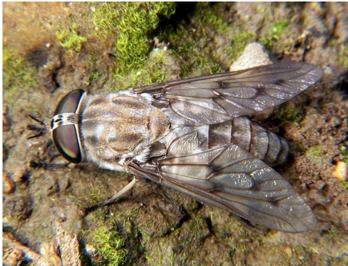
5.21 Een daas wordt vaak verward met een horzel, maar deze laatste steek niet.

Vliegen voeden zich met vloeistoffen (enkele echter ook met stuifmeel) die ze opzuigen. Soms laten ze vloeistof over een vastere voedsel bron lopen en zuigen het vervolgens weer op. Horzels zuigen bloed, althans de wijfjes; de mannetjes zoeken hun voedsel op bloemen. Dit is een bijzonder voorbeeld van het voorkomen van voedselconcurrentie tussen de geslachten.