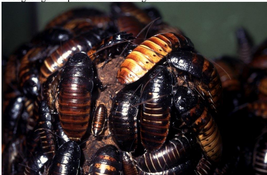
5.25 Kakkerlakken behoren tot de minst geliefde insecten.

Huishoudelijke warmte schept een uitzonderlijk droog klimaat. Brood- en tapijtkevers leven in onze huizen in misschien wel de droogste biotopen op aarde; niet verwonderlijk, want ze zijn nauw verwant met in woestijnen levende kevers. Waar de omstandigheden vochtiger zijn, zoals in keukens en kelders, leven vaak zilvertisjes (verwant aan het papiervisje) en pissebedden. Een extra voordeel voor die dieren die in een huis leven, is het ontbreken van natuurlijke vijanden. De enige rovers zijn daar meestal spinnen, die dikwijls door de mens worden doodgeslagen in plaats van als bondgenoten beschouwd.