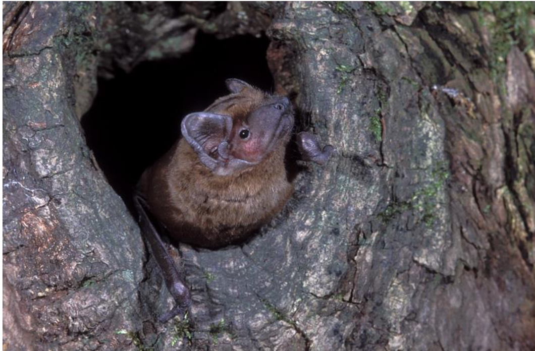
5.30 De Rosse vleermuis in zijn woning in een holle boom.

produceert twee soorten ontlasting. De eerste bevat nog veel voedingsstoffen en wordt opnieuw gegeten, de tweede wordt op een vaste toiletplaats geloosd. Net als alle knaagdieren die zich snel voortplanten heeft het konijn een massa vijanden. Behalve door de mens wordt het belaagd door hermelijn, wezel, bunzing, vos en vogels.