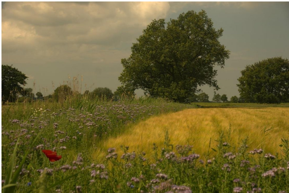
Figuur 5.1 Akker met bloemrijke rand

In dit hoofdstuk wordt een groot aantal planten en dieren besproken die de mens rondom zijn huis kan ontmoeten. Meestal hebben ze zich in de loop van de tijd uitstekend aangepast aan de omstandigheden die de mens door zijn aanwezigheid schept, ook al wijken die aanzienlijk af van de natuurlijke biotopen waarin ze vroeger leefden.