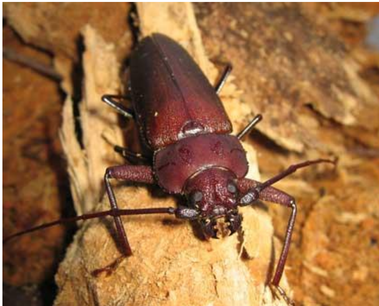
5.19 Een hout-etende boktor

Hij verpopt zich vlak onder het houtoppervlak, zodat de kever in staat is zich te bevrijden, ondanks zijn zachtere kaken. Er ontstaan dan de bekende gaatjes.