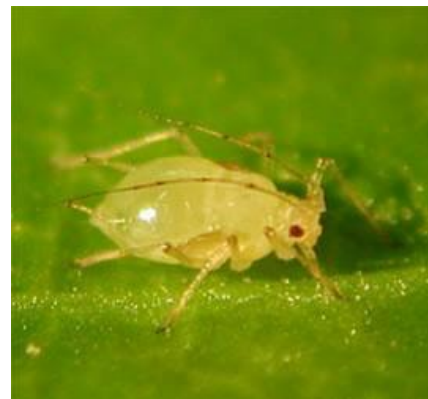
Figuur 5.16 Bladluizen