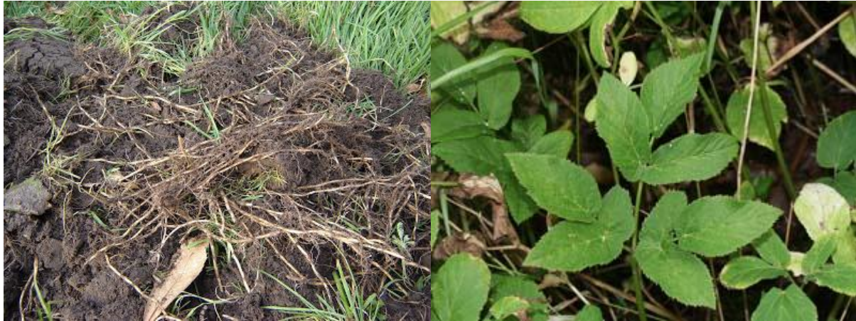
5.13 Kweek en zevenblad, twee onverwoestbare onkruiden met wortelstokken.