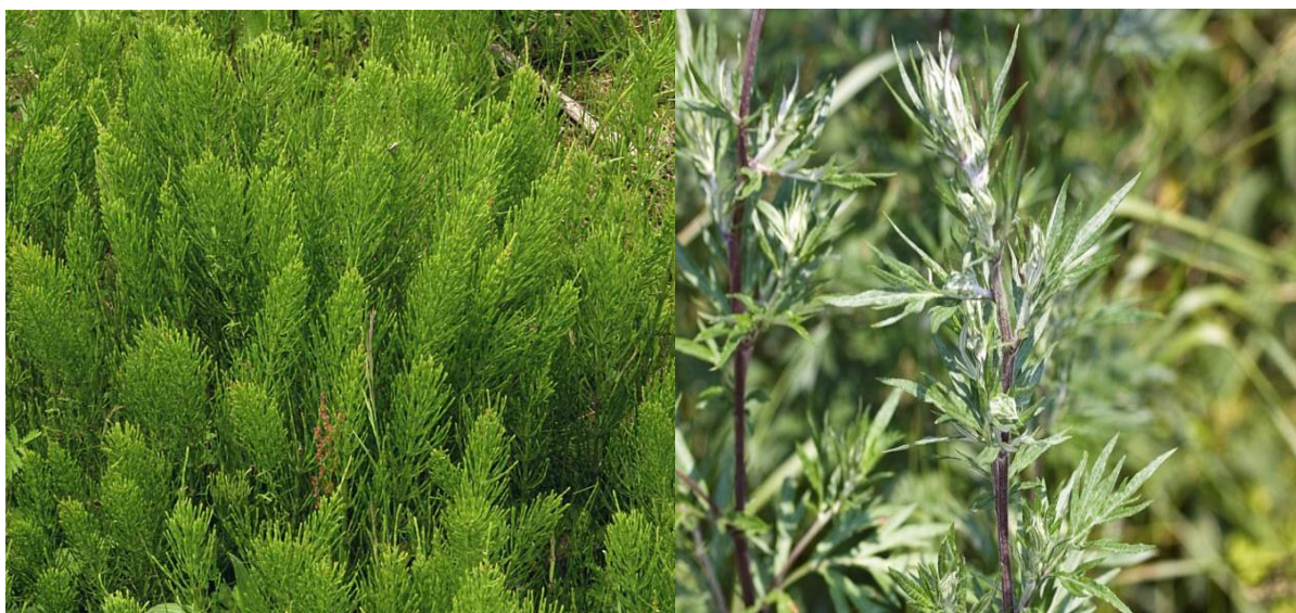
Figuur 5.14. Twee onkruiden: heermoes en bijvoet.

Een plant op braakliggende terreinen is de bijvoet. Deze forse plant vond vroeger in de volksgeneeskunde ruime toepassing; zijn aromatische bladeren werden wel in mottenbuitjes in linnenkasten gelegd. Brandnetels worden door de meeste mensen onaangename planten gevonden. Ze zijn zeer talrijk op vooral stikstofrijke plaatsen. De grote brandnetel, met zijn kruipende wortelstok, is een vaste plant, maar de kleine brandnetel is eenjarig.