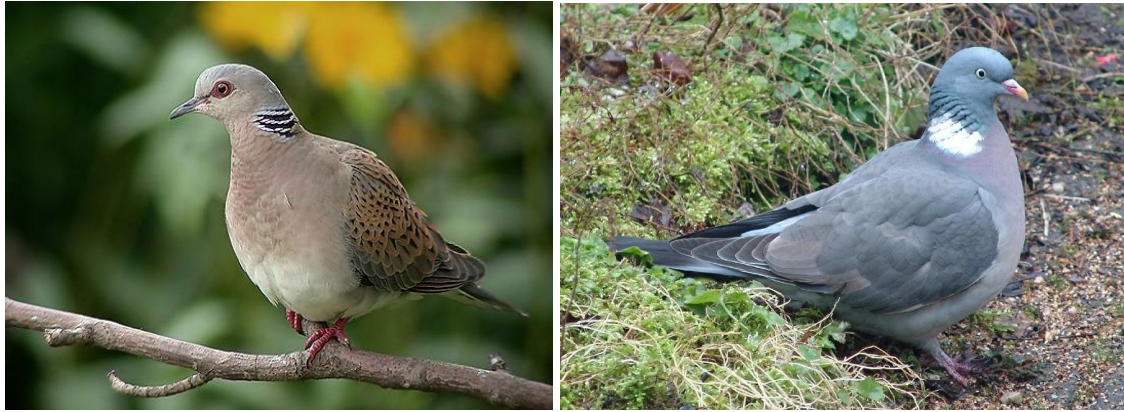
5.28 Twee duiven: de zeldzame zomertortel (l) en de algemene houtduif (r)