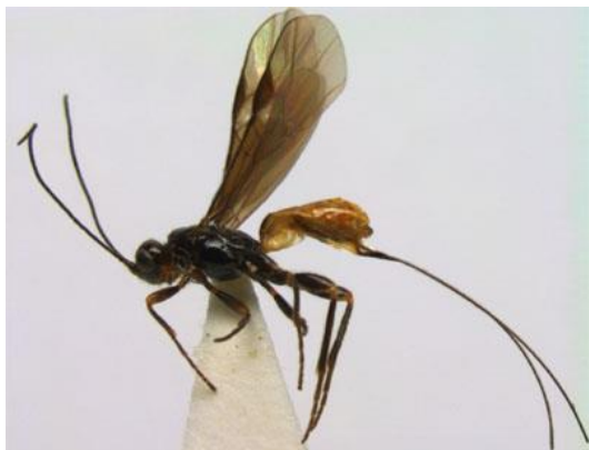
5.23 Een sluipwesp met een legboor.

Parasitaire wespen zijn gewoonlijk slanke insecten die hun angel gebruiken om rupsen en spinnen te verlammen. Ze leggen hun eieren in een levende gastheer. Soms is dit een plant en ontstaan er gallen, soms een spin of rups, die door de wespenlarven van binnenuit wordt leeggegeten.