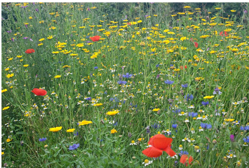
Figuur 2 Akkeronkruiden als korenbloem, klaproos, gele ganzenbloem en echte kamille.