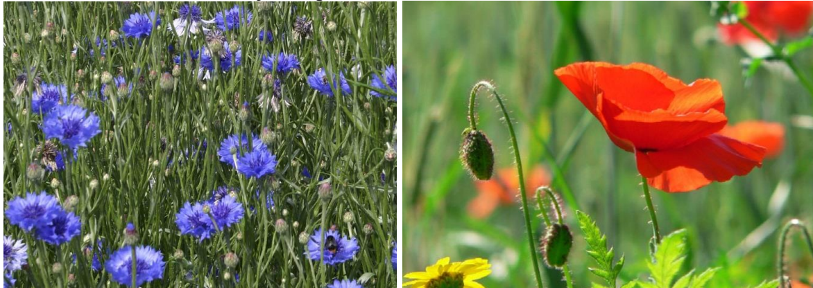
Figuur 5.12 Twee akkeronkruiden van de vroegere graanakker: korenbloem en klaproos.

Een van de lastigste onkruiden is de akkerdistel, die ook op stortplaatsen en in tuinen veel voorkomt. De zoetig geurende bloemen trekken behalve veel vliegen en kevers ook bijzonder veel dagvlinders aan. Zijn pluizige zaden worden door de wind verspreid, terwijl de plant zich bovendien door middel van zijn kruipende wortelstok vermeerdert.