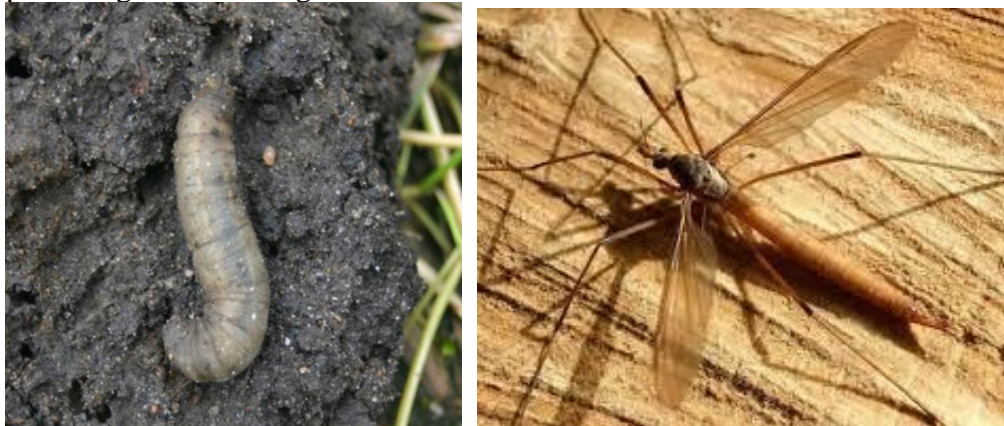
5.20 Een emelt en de daaruit voortgekomen langpootmug

De vliegen en muggen vormen samen de orde Tweevleugeligen. Ze danken de naam Tweevleugeligen aan hun meest karakteristieke kenmerk. Insecten bezitten namelijk gewoonlijk vier vleugels, maar bij vliegen en muggen is het achterste paar gereduceerd tot een stel knotsvormige kolfjes of halters, die als evenwichtsorgaan dienst doen. Het bezit van slechts één paar vleugels onderscheidt de zweefvliegen van de wespen en bijen, waarop ze lijken. Deze ongevaarlijke vliegen hebben geen angel, maar dragen als bescherming wel de waarschuwingskleuren van stekende insecten. Zweefvliegen komen veel in tuinen voor en danken hun naam aan hun gewoonte: voor een bloem stil in de lucht te hangen om dan plotseling naar een volgende bloem te schieten.