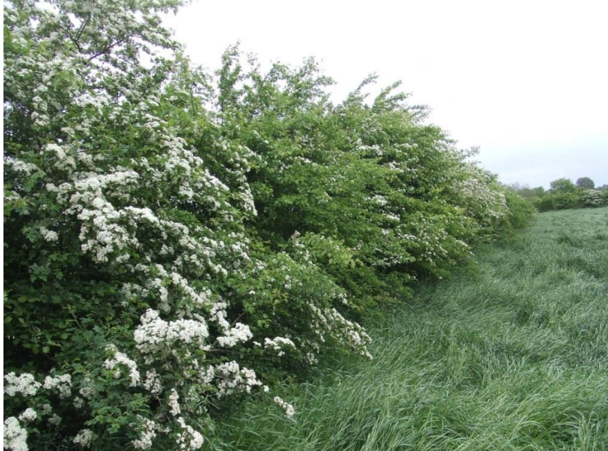
Figuur 5.8 Meidoorns in een heggenlandschap.

De moderne trend in de landbouw brengt het rooien van vele kilometers heggen met zich mee.