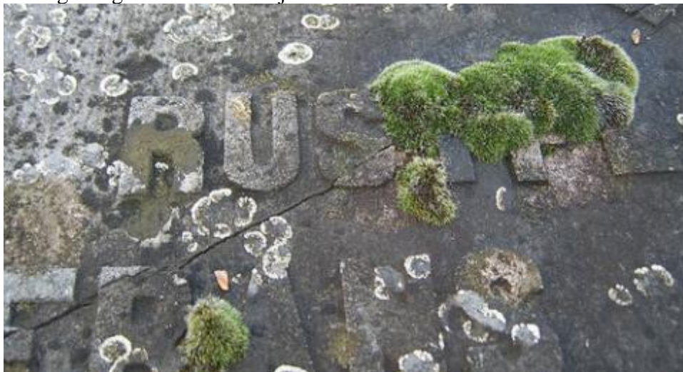
Figuur 5.4 Korstmossen op een grafzerk.

De interessantste natuurreservaatjes in de stad zijn misschien wel sommige privétuinen. Hun omvang en de wijze waarop ze worden onderhouden bepalen de waarde ervan als biotoop voor planten en dieren. Hoewel er veel mensen zijn die hun tuin pijnlijk schoon houden, zijn er ook die nooit spuitmiddelen zullen gebruiken, zorgen voor besdragende struiken voor de vogels, nectarrijke planten zoals vlinderstruiken aanplanten, nestkastjes ophangen en een schoteltje melk neerzetten voor egels. Een kleine tuinvijver, zo mogelijk met een moerasgedeelte, lokt allerlei waterdieren, zoals kikkers, libellen en padden. Met waterplanten komen er ongewervelde waterdieren in de vijver terecht. Al snel vestigen zich enkele waterslakken, eendagsvliegen en schaatsenrijders.