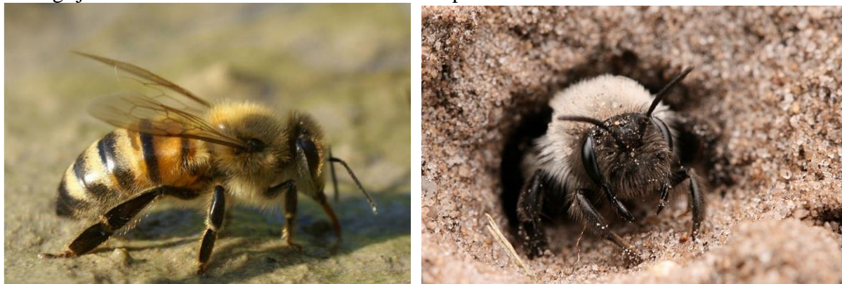
5.22. Twee geheel verschillende bijen: een honingbij (l) en een zandbij (r)

Over het algemeen bekijkt de mens bijen welwillend, omdat ze voor hem van nut zijn. Tamme bijen leveren per korf soms wel 200 kg honing per seizoen op, maar daarnaast zijn ze ook zeer belangrijk als bestuivers van vruchtbomen en tuinplanten.