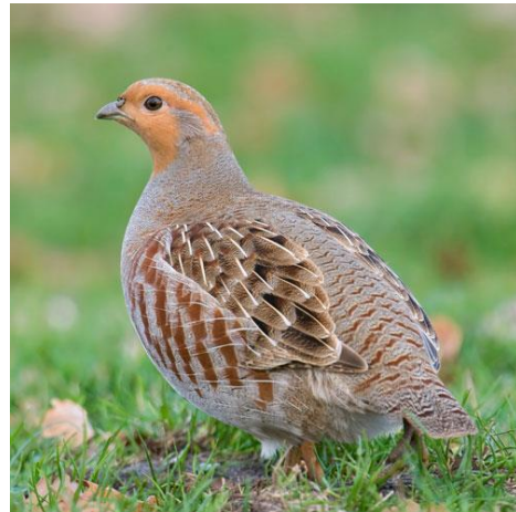
5.27 Twee kwetsbare soorten van het akkerland: de kwartel (l) en de patrijs (r)

Verder zijn er veel vogelsoorten die zich bij voorkeur op en rond boerenerven ophouden. Bekende voorbeelden zijn boerenzwaluw, huiszwaluw, huismus, ringmus, spreeuw, koolmees en steenuil.