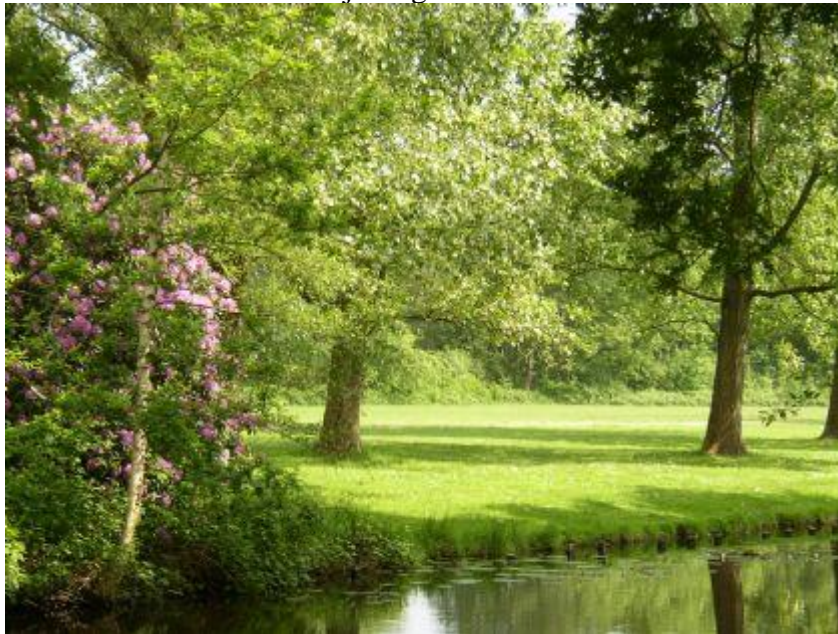
Figuur 5.3 Een stadspark