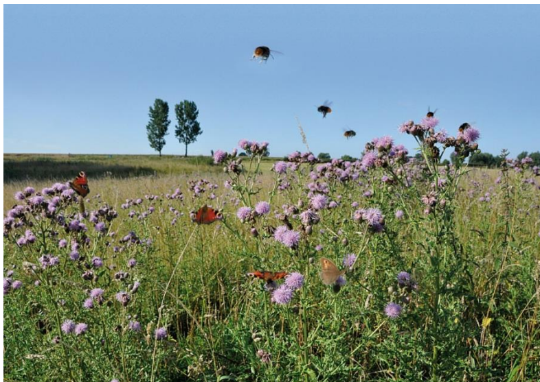
Figuur 5.11. Tegen de distel als akkeronkruid kun je op verschillende manieren aan kijken.

De mens onttrekt steeds meer ruimte aan de natuur voor de aanleg van wegen, voor huizenbouw, industrieterrein en de landbouw. Het aantal door de mens geschapen biotopen neemt dus steeds toe. Zelfs op de meest onherbergzame plaatsen, zoals spoorbruggen of stortplaatsen van industrieel afval, komt men altijd nog planten tegen. De meesten van ons wonen in steden en als men daar zijn ogen de kost geeft, staat men verbaasd over de vele wilde planten die er te zien zijn, nog afgezien van de bewust geplante en gezaaide in onze tuinen.