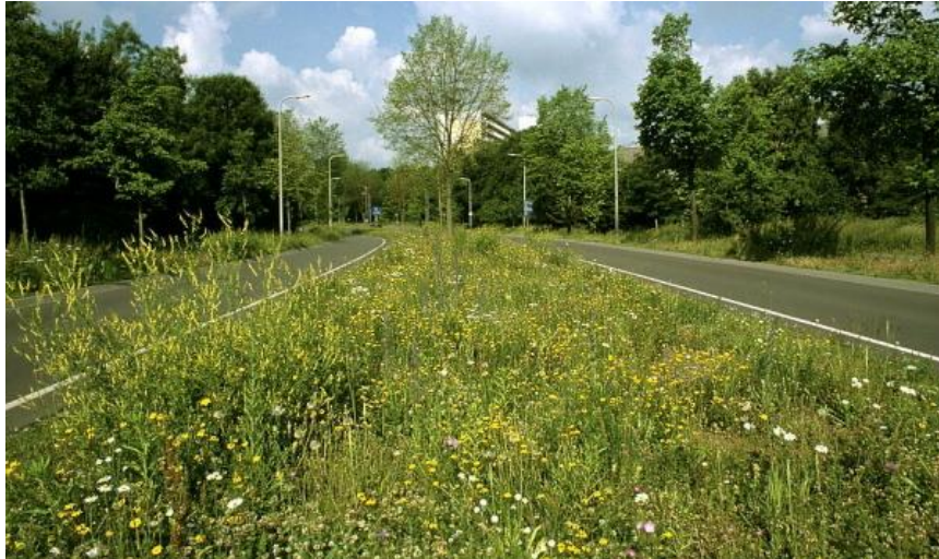
Figuur 5.7 Veel bermen worden bewust met een bloemrijk grasmengsel ingezaaid.