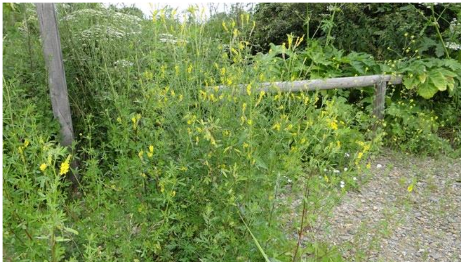
Figuur 5.15 een ruderale plek