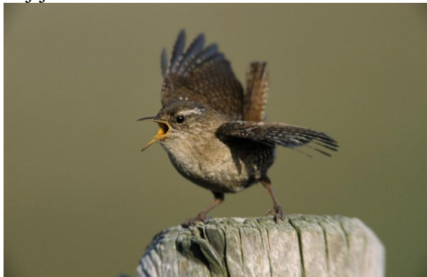
Figuur 5.10 Een kenmerkende soort van struwelen is de winterkoning.

Een typische bewoner van dichte heggen is het winterkoninkje. Als een muis scharrelt hij door het dichte gebladerte, op zoek naar insecten. Zijn ratelend liedje zingt hij echter meestal op een duidelijk zichtbare plaats. Het mannetje bouwt verschillende bolvormige nesten, waarvan het wijfje er één uitkiest en verder voltooit. De 5-8 eieren worden in twee weken uitgebroed.