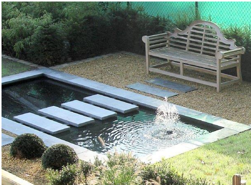
Figuur 5.5 Een voorbeeld van een vrij steriele tuin.

sprinkhanen, wespen, zweefvliegen, gaasvliegen, kevers - waaronder loopkevers, soldaatjes en lieveheersbeestjes -, langpootmuggen en sluipwespen. Diverse slakken zullen het oude blad opruimen en spinnen weven hun webben tussen de planten.